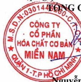
Nguyễn Hữu Thọ