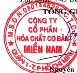
Nguyễn Hữu Thọ